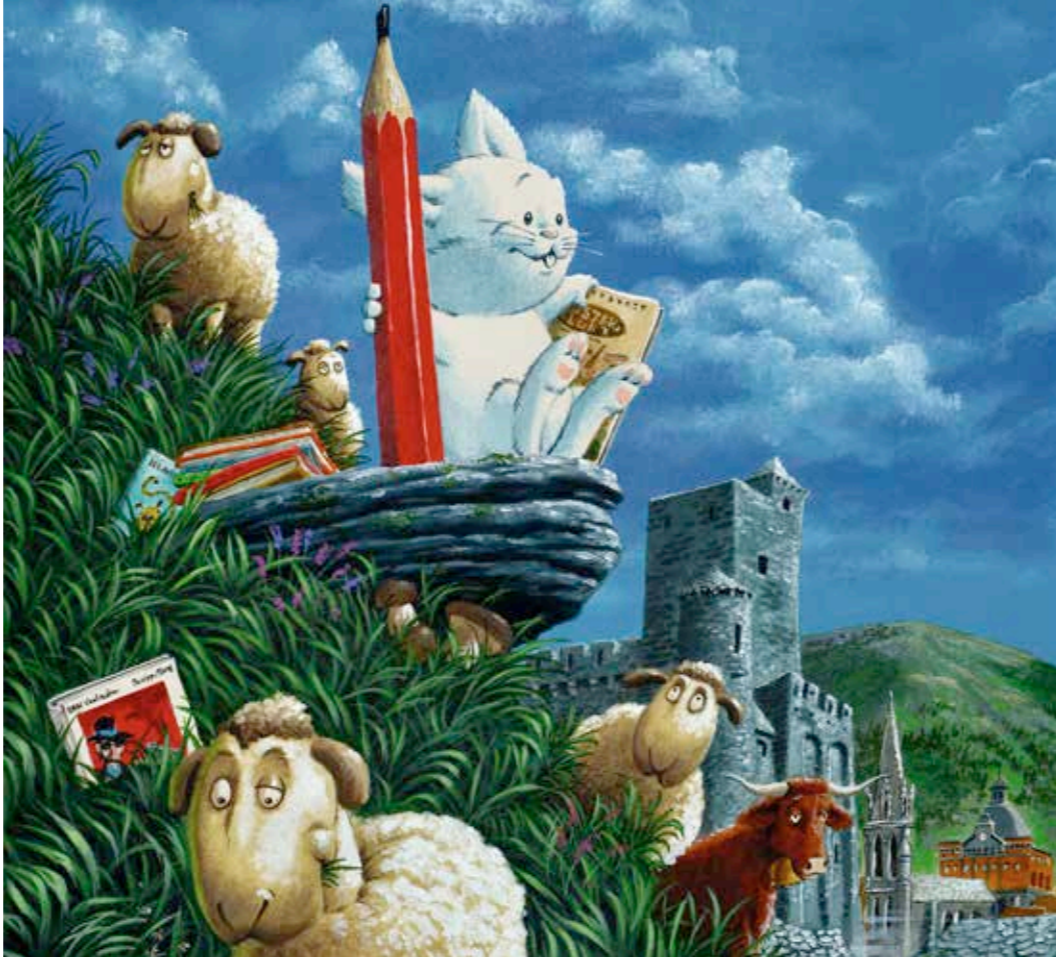
Dessin original : Masbou

Pensez aussi à aimer notre page Facebook : www.facebook.com/festivalbd.caba